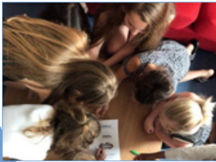
Kinderraad spreekt voorkeur uit voor nieuw logo

We stralen en schitteren en zijn trots op onszelf. We hebben het lief veranderingen aan te gaan en grenzen te verleggen. We vieren mijlpalen, delen momenten en creëren herinneringen. We zien uit naar de toekomst en hebben plezier in ons werk.