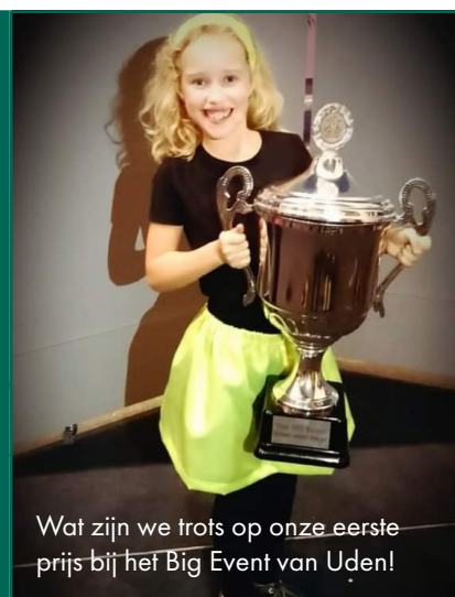
Wat zijn we trots op onze eerste prijs bij het Big Event van Uden!

We zijn wat we zeggen en zien elkaar. De mens staat centraal niet de functie. We geven vorm aan pedagogisch partnerschap. Respect en vertrouwen in elkaar vormen onze basis. We laten zien wat we kennen, wat we kunnen en wie we zijn.