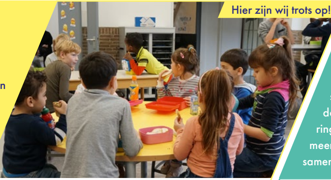
Hier zijn wij trots op!

We zijn dit schooljaar gestart met een (vernieuwd) onderzoek naar de behoeftes van de kinderen. De meeste kinderen zijn kinderen van gevluchte ouders. Sommige zijn hier geboren, sommige kinderen zijn getuige geweest van een oorlog en zijn nog kort in Nederland. Omdat we een kleine school zijn, lukt het ons om veel samen te doen. Zo voelen we ons verantwoordelijk voor alle kinderen. We creëren een veilige situatie waarin kinderen kunnen leren. Onderwijs is voor hen belangrijk om ook een goede startpositie te verkrijgen in de samenleving.