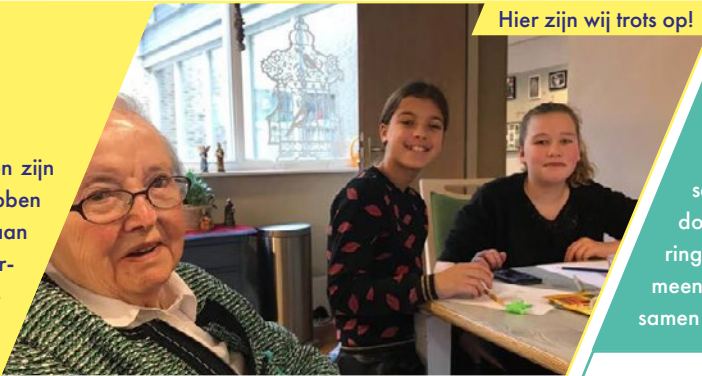
OBS De Uilenbrink heeft veel te geven!

We stralen en schitteren en zijn trots op onszelf. We hebben het lef veranderingen aan te gaan en grenzen te verleggen. We vieren mijlpalen, delen momenten en creëren herinneringen. We zien uit naar de toekomst en hebben plezier in ons werk.