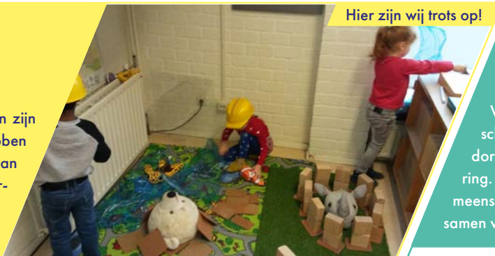
Hier zijn wij trots op!

'De dag van het jonge kind' heeft de leerkrachten geïnspireerd om de spelbeleving nog meer te koppelen aan de doelen die ze willen bereiken met de kinderen.