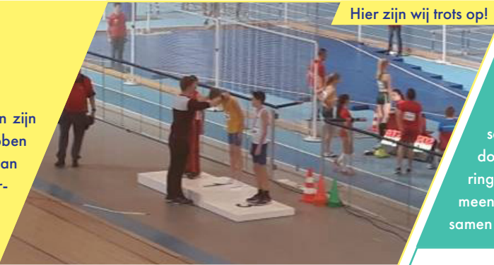
Hier zijn wij trots op!

We schitteren vanwege de invoering van Blink (WO geïntegreerd), het nieuwe meubilair bij groep 3/4 1e Stroming en een leerling die Nederlands kampioen atletiek is geworden!