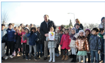
OBS Kompas ontvangt als eerste school vignet Gezonde School

We stralen en schitteren en zijn trots op onszelf. We hebben het lief veranderingen aan te gaan en grenzen te verleggen. We vieren mijlpalen, delen momenten en creëren herinneringen. We zien uit naar de toekomst en hebben plezier in ons werk.