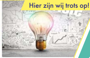
Hier zijn wij trots op!