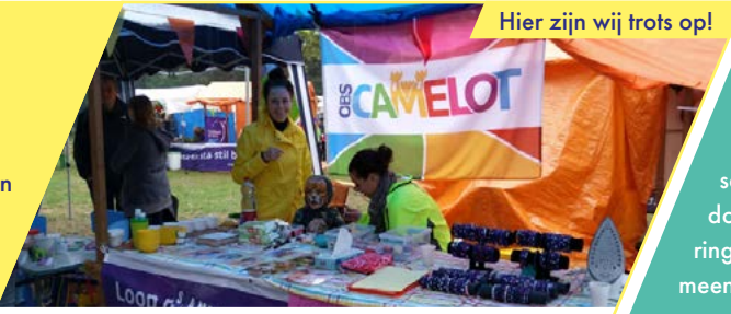
Hier zijn wij trots op!

We stralen en schitteren en zijn trots op onszelf. We hebben het lef veranderingen aan te gaan en grenzen te verleggen. We vieren mijlpalen, delen momenten en creëren herinneringen. We zien uit naar de toekomst en hebben plezier in ons werk.